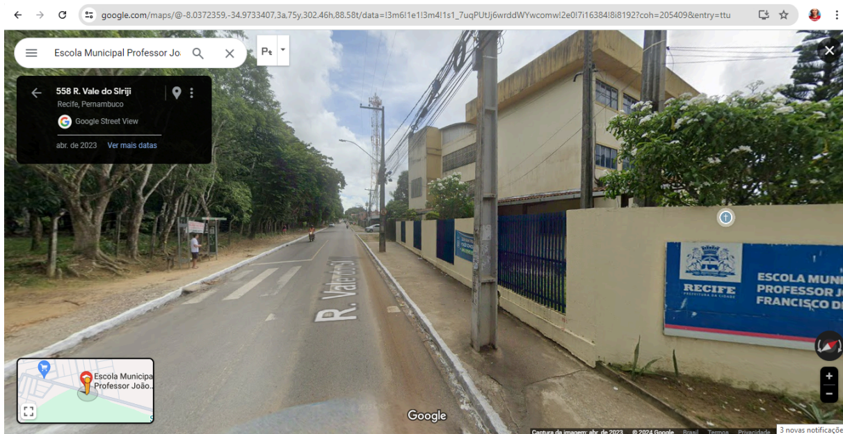
Imagem 01: Faixa de pedestres em frente à Escola Municipal Professor João Francisco de Souza, Rua Vale do Siriji, 558, Várzea, Recife/PE, 50970-250.