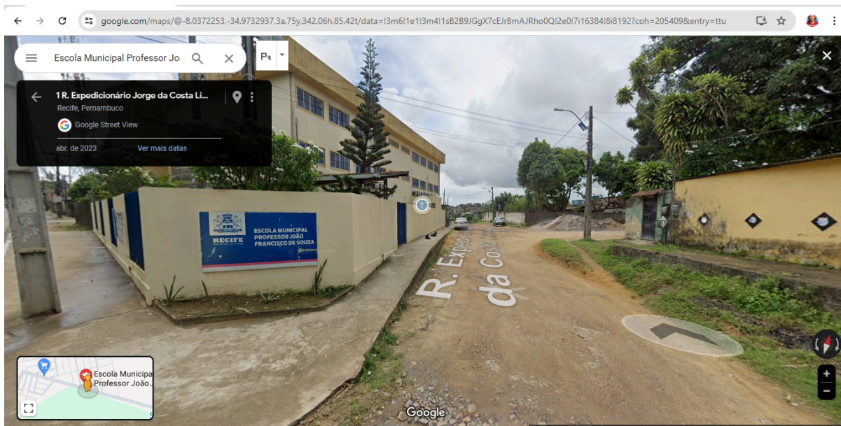
Imagem 02: Rua Expedicionário Jorge da Costa Lima, 386 - Várzea, Recife - PE, 50970-250