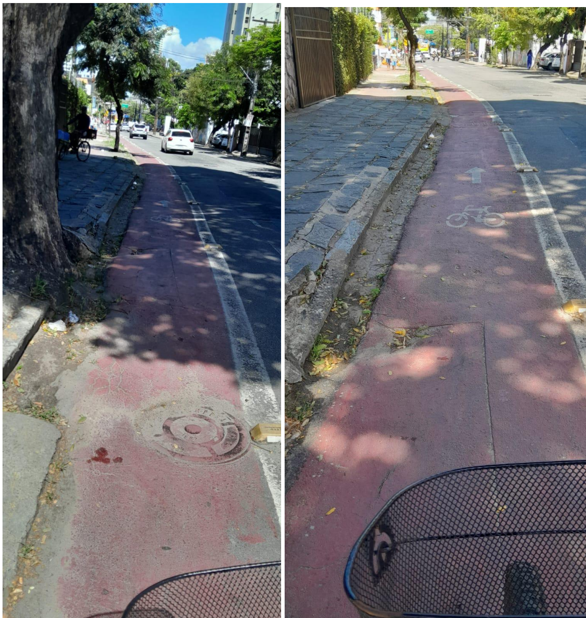
Rua Castro Alves

REQUERIMENTO Nº 13136/2023 - Protocolo nº 20384/2023 recebido em 05/12/2023 12:24:03 - Esta é uma cópia do original assinado digitalmente por Liana Cirne Para validar o documento, leia o código QR ou acesse https://e-processo.recife.pe.leg.br/contenir_assinatura e informe o código 6948-8F-47-883B-2BBA.