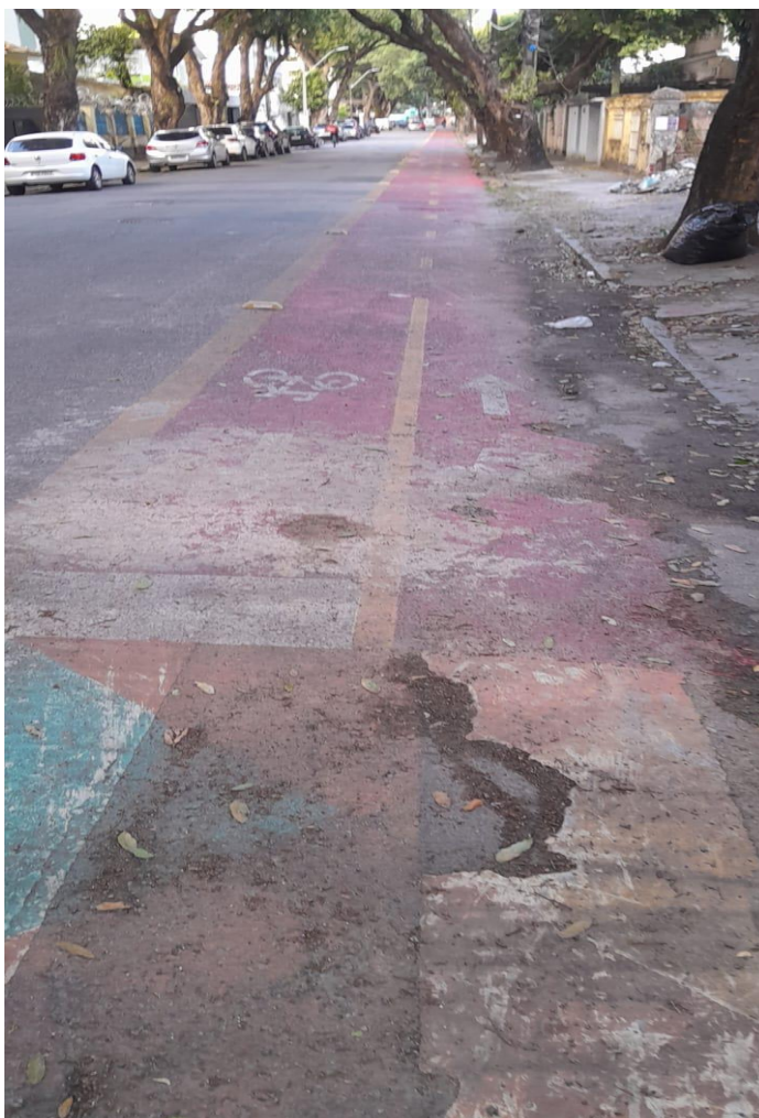
R. Marquês do Paraná, esquina com a Av. João de Barros.