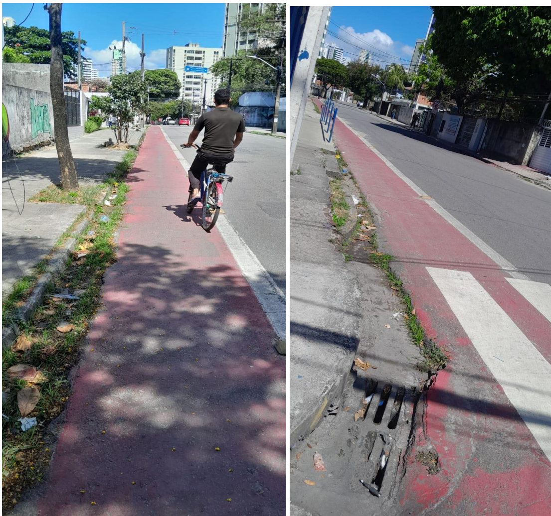
Rua Castro Alves