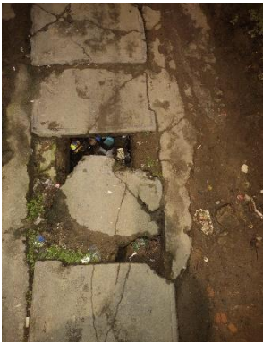
Foto Avenida Barão de Bonito, nº 34, próximo ao armazém São Luiz, Várzea, Recife.