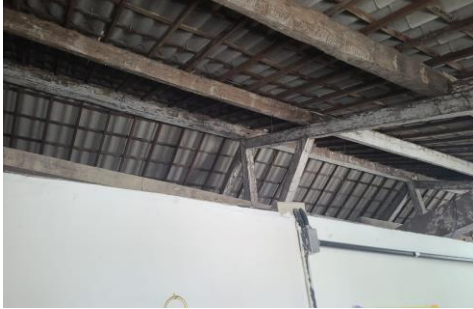
Foto Escola Municipal Virgem Poderosa, R. Leonardo Bezerra Cavalcante, 116 - Jaqueira, Recife.