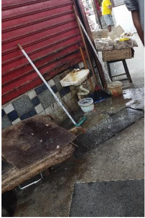
Foto Mercado público de Afogados, Estr. dos Remédios, S/N - Afogados, Recife.