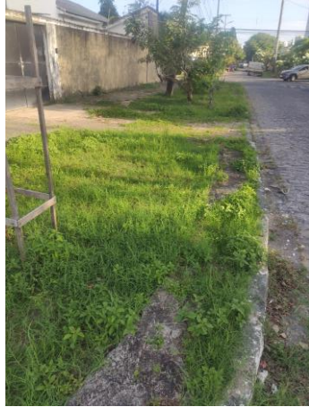
Foto Rua Inácio Galvão dos Santos, em frente ao número 481, Encruzilhada · Recife.