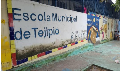
Foto Escola Municipal De Tejipio, R. Tutóia, 165 - Tejipio, Recife.