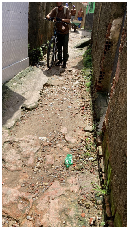
Trecho da Rua Padre Henrique, Vila Arraes, Várzea, Recife/PE, CEP 50810-600.

Ressaltamos a importância do escoamento das águas no que tange à saúde pública para as precauções contra as doenças denominadas Arboviroses, transmitidas por mosquitos, como a dengue e Chikungunya e a Zika. É imprescindível evitar a propagação de outras doenças que além que levariam as pessoas a lotar as UPAs em busca de tratamento