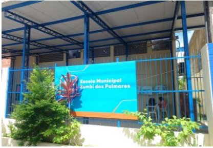
Foto Escola Municipal Zumbi dos Palmares, R. Eng. Vasconcelos Bittencourt, 35 - Várzea, Recife.