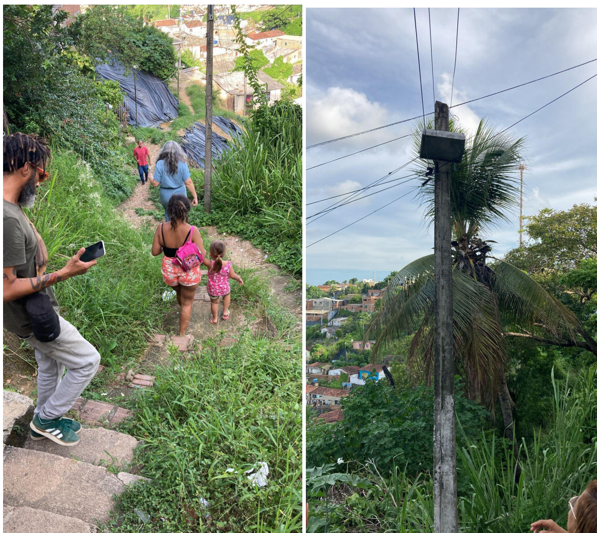
Foto que demonstra o poste de iluminação existente e a precariedade do local de passagem.