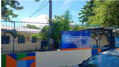
Foto Creche Escola Recife Governador Miguel Arraes, Rua Doutor Gil Rodrigues dos Santos, nº 10, Areias Recife.