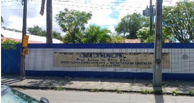
Foto Escola Municipal Professor Antônio De Brito Alves, Rua Ernesto Cavalcanti, 41 - Mustardinha, Recife.