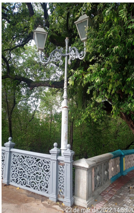
imagem 03: Foto de vistoria em 22 de março de 2022

Segundo matéria veiculada pelo site “Oxe Recife”, as luminárias foram retiradas pela EMLURB para manutenção. 1