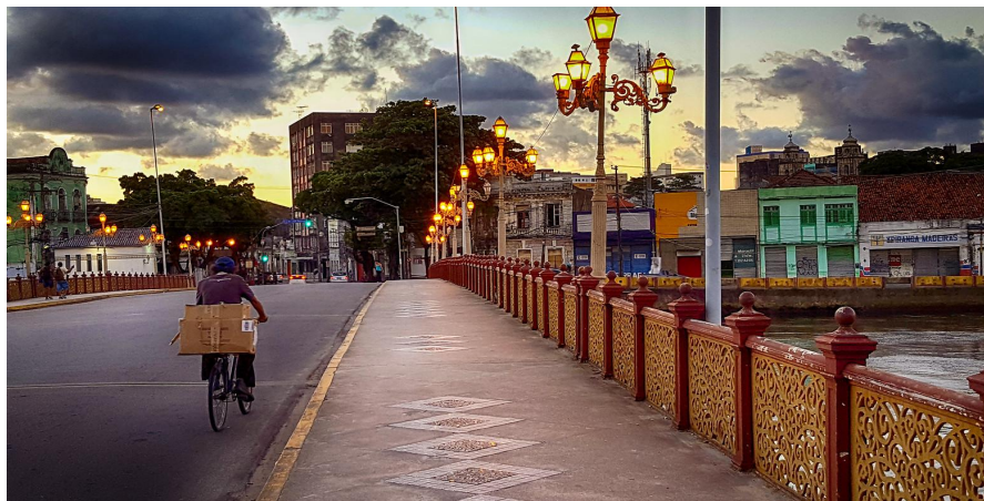
imagem 01

Além disso, realizamos vistoria que e percebemos, consoante imagens a seguir anexas, a ausência de uma luminária em cada poste: