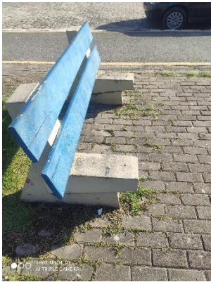
Foto Praça do Rotary, Caxanga, Recife.