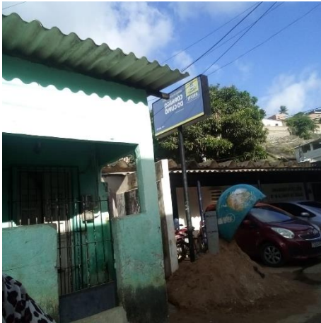
Foto USF Córrego do Curió, Rua Córrego do Curió, 90 - Dois Unidos, Recife.