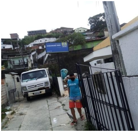
Foto Unidade de Saúde Prof. Bruno Maia, Rua. Alto do Refúgio - Nova Descoberta, Recife.