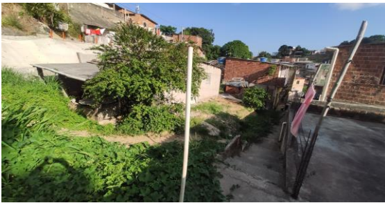
Foto Rua Palmelo, COHAB, Recife.