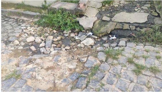
Foto Rua Água Clara, Várzea, Recife.