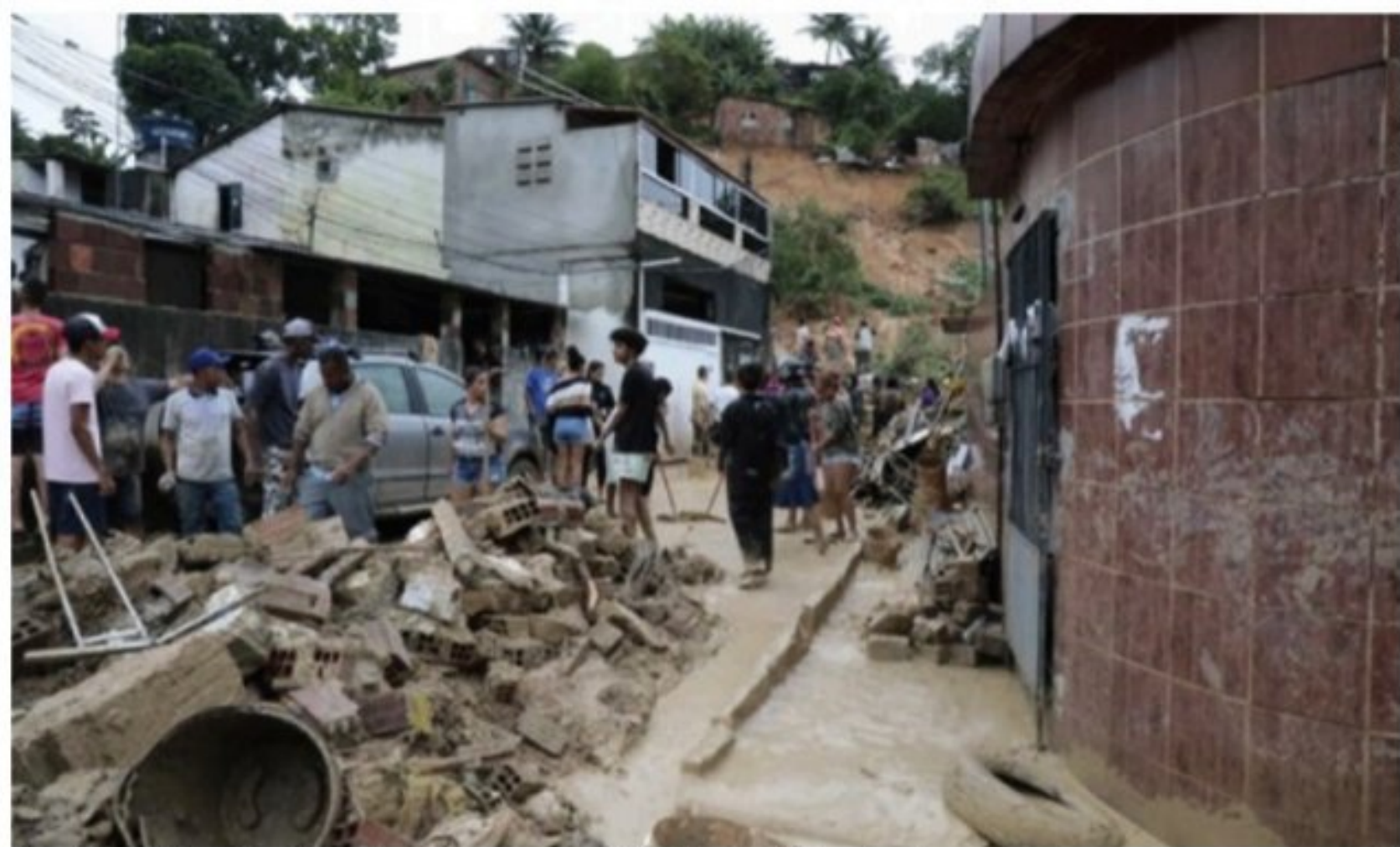
JARDIM MONTE VERDE Em Jaboatão dos Guararapes: comunidade enfrenta tragédia que tem descaso como origem e mortes como consequência

CHUVAS Classe política pernambucana precisa ser cobrada pelo que aconteceu neste sábado