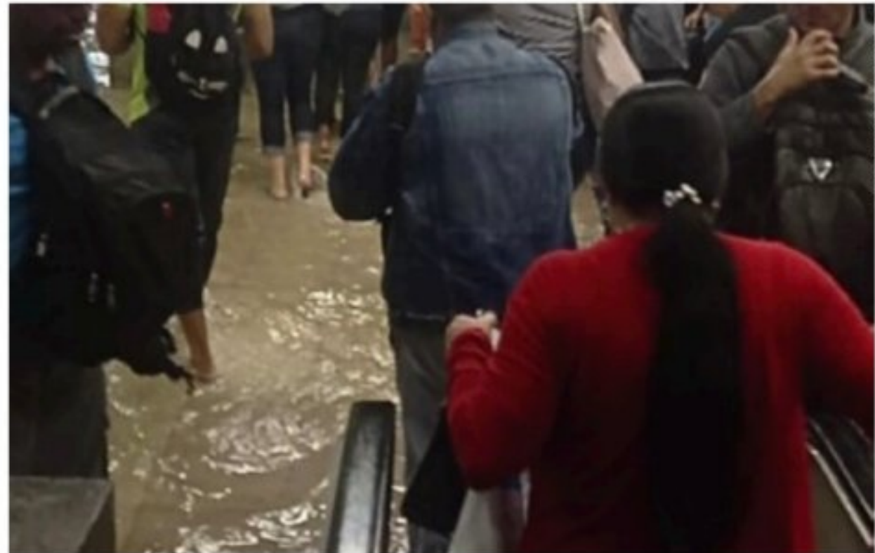
ESTAÇÃO JOANA BEZERRA Metro do Recife: com ou sem chuva, só descaso e desatenção do poder público

Querem deixar esse exercício de descobrir o que é previsível ou não ainda mais sombrio? Adivinhe, então, o que foi que aconteceu em junho de 2015? Resposta: pai e filho morreram soterrados