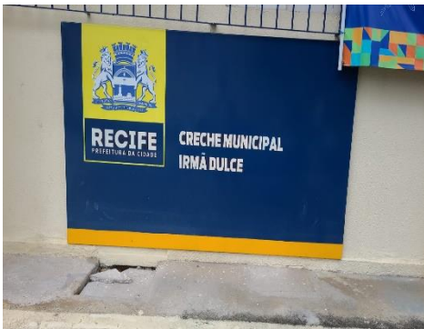
Foto Creche Municipal Irmã Dulce, R. Adalgisa, s/n - Torreão, Recife.