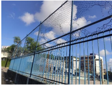
Foto Praça Professor Barreto Campello, Torre, Recife.