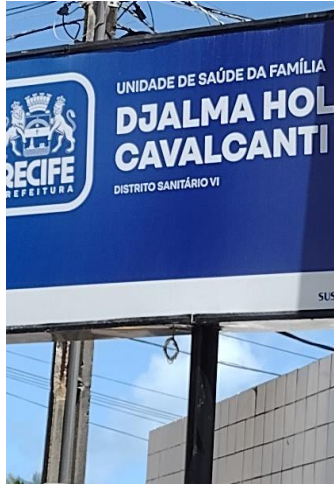
Foto da Usf - Centro de Saúde Djalma de Holanda Cavalcante, Rua Delfin - Brasília Teimosa, Recife.