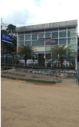
Foto da (USF) – Jardim Teresópolis, Rua Expedicionário Antônio Romano, Várzea, Recife-PE.