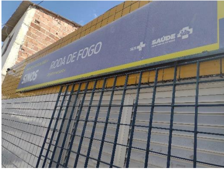
Foto do USF – Roda de Fogo – Sinos, R. dos Sinos, 35, Torrões - Torrões, Recife.