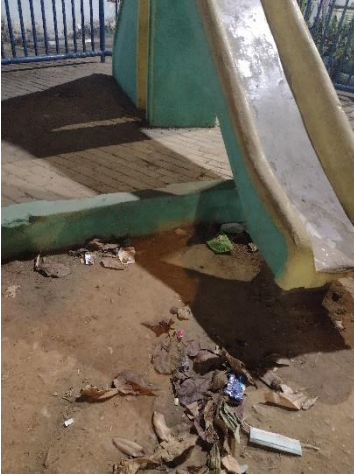
Foto da Praça da Rua Alto José Bonifácio S/N Casa Amarela - em frente a escola estadual Caio Pereira e ao lado da Quadra do Bonifácio, Recife.