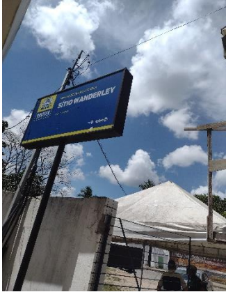
Foto do USF Sítio Wanderley, R. Emetério Maciel, 309 - Várzea, Recife.