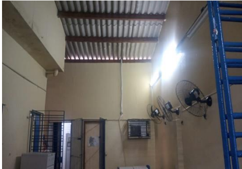
Foto da Escola Municipal Engenheiro Edinaldo Miranda, s/n, Encruzilhada, Recife.