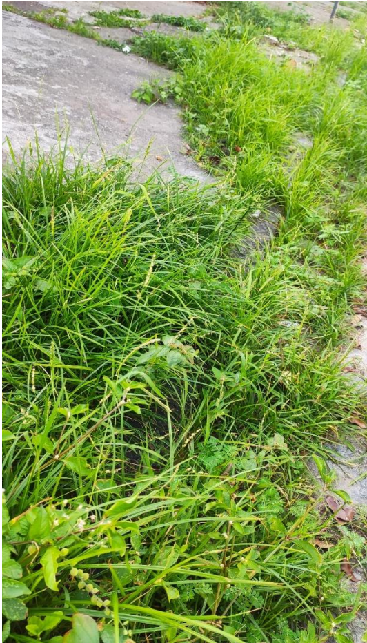
Foto da Rua Gaspar Drumond. Afogados, Recife.